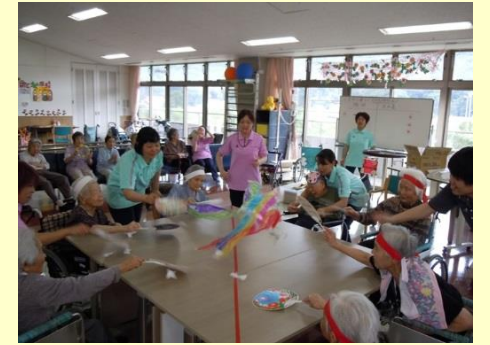
今年も出場！3施設対抗 「風船バレー大会」 ☆今年も3位☆