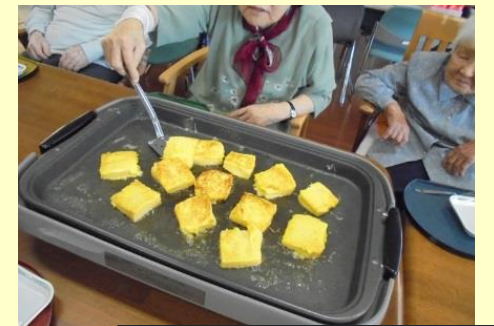
せせらぎの畑で採れた じゃがいもで「じゃがいももち」 を作りました