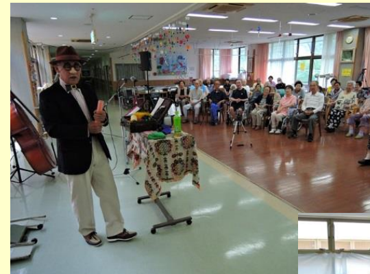
「OKS(オークス)」様ご来所 マジックショー&バンド演奏も～♪