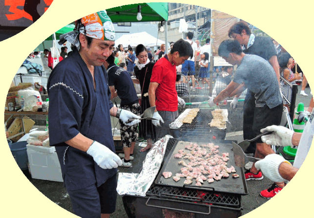
本郷中央病院では毎年屋台にて焼き鳥を販売しております。