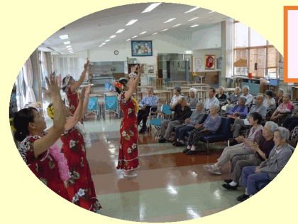
「フアラボンダンス」様ご来所 どこかで見たことあるような方々...