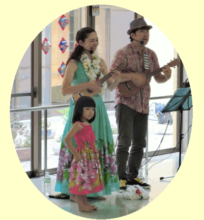
「こうだFUSAIウクレレ」様ご来所