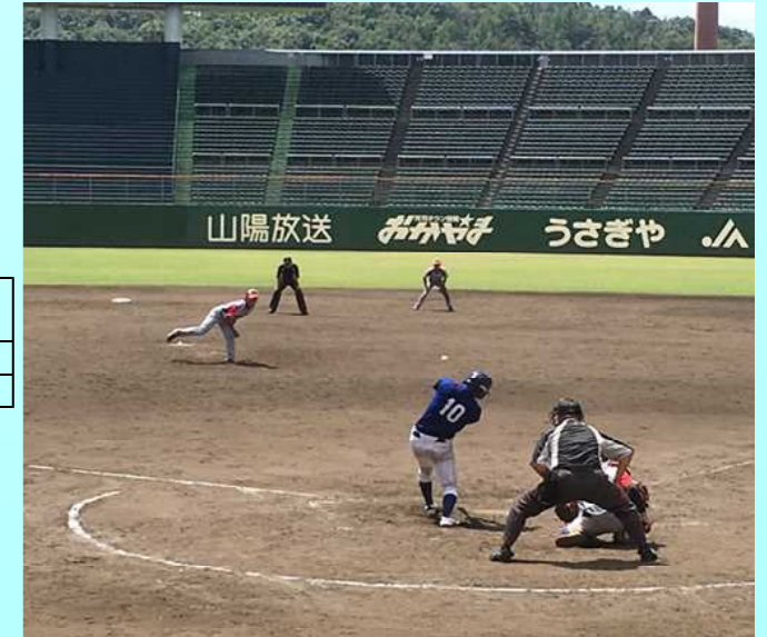
写真：小泉病院攻撃時