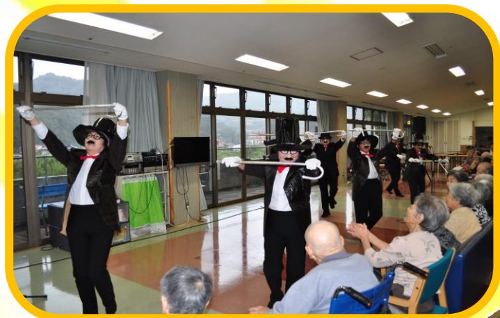
船木女性会の皆様