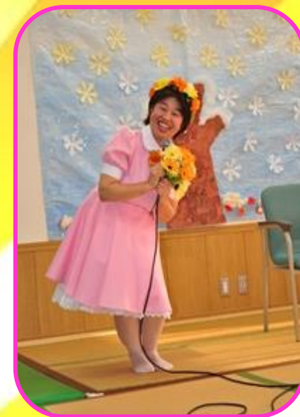
リーダーグッドジョブ！