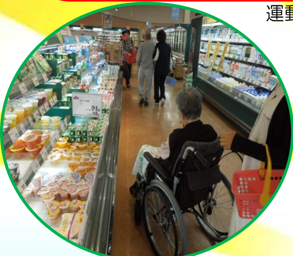
お買い物へお出かけ