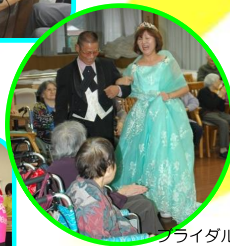
ブライダルショーもどきです