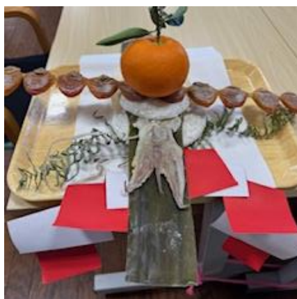
デイケアの餅つきにて鏡餅を作りました