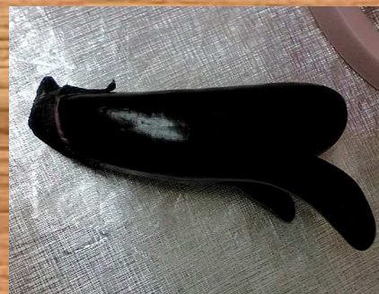
「ゆあ・ポートに変わった茄子の登場」